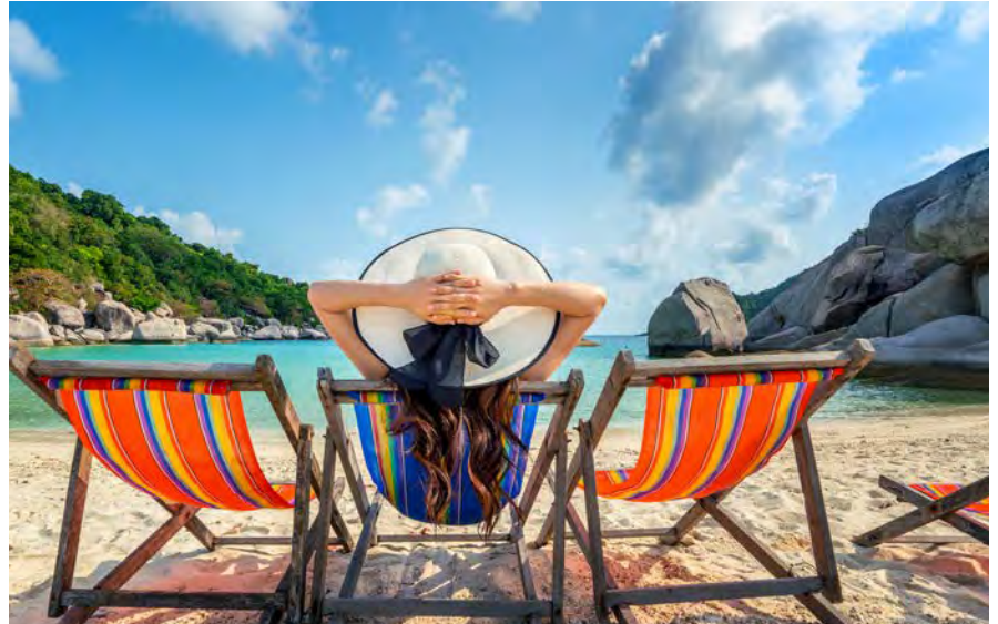
La diáspora puertorriqueña es otro gran mercado de viajeros frecuentes y consumidores en la isla.

“Nuestro clima, cultura, gente, paisajes, y música, atraen al turista de todo el mundo.”